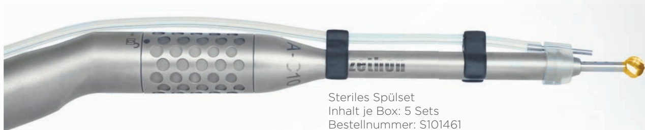
Steriles Spülset Inhalt je Box: 5 Sets Bestellnummer: S101461